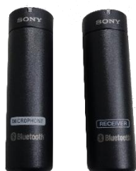
▲マイク・レシーバー ECM-AW4