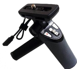
▲三脚機能付シューティンググリップ GP-VPT1