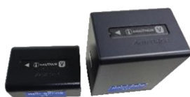
▲バッテリー NP-FV50V NP-FV100A