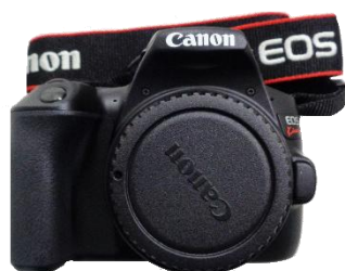
▲カメラ EOS kiss X10