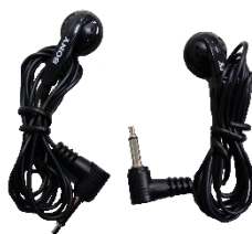
▲イヤホン 2 個