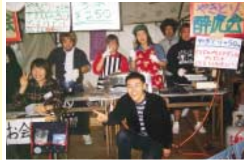
↑ときわ祭で焼き鳥屋を出店