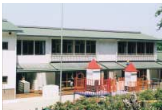
→二階が増築された園舎

急速に進む少子化が問題とされる反面、現在の社会は、子育てをしながら働く女性を支援する、保育施設などの整備が望まれている。