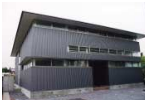
↑常磐学園合宿所ミーティングルーム