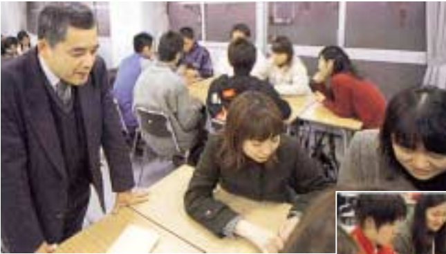
●体験的に学ぶ「社会福祉援助技術演習」

「私はもとと臨床心理学が専門で、医学や心理学、それに社会学も関わってくるような領域の中で研究に取り組んでいて、いまいちはん関心をもっているのは、『ひきこもり』、ひきこもりですね。特に若い人たちの『ひきこもり』が急増している現状を見ると、これは何が原因かというところ、一体どうすれば