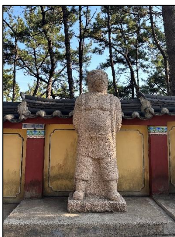
←海東竜宮寺にある돼지띠（豚年）の像

さらに、干支は韓国にもあり、ほとんど日本と同じ動物で、順番も同じだが、日本ではいのししであるところが、韓国ではぶたであることを初めて知り、驚きだった。