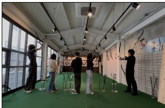
韓国の学生たちとアーチェリーしている様子

そして大邱では、大邱カトリック大学を訪問し、現地の学生との交流を行った。大学の施設の見学や授業に参加した。最終日には、大邱カトリック大学の学生と大邱市内を散策した。アーチェリーをしたり、ご飯を食べたり、デパートに行き、とても楽しい時間を過ごした。