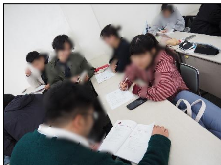
日本語の授業に参加したときの様子

私は、人見知りで韓国の学生と上手くコミュニケーションが取れるか不安が大きかった。しかし、交流会や参加した授業では韓国の学生が日本語で積極的に話してくれて、たくさんのお話をすることができた。もともと韓国語を聞く機会が多かったり、韓国語を勉強していたことで、先生や学生が韓国語で話していても、何を言っているのかある程度理解することはできたが、自分から韓国語で話すことがあまりできなかったのが悔しかった。また、ご飯を食べに行ったり歩いているときなど、様々な場所で韓国の方々から日本語で声をかけてくれることが多く、自分の国の言語を話してくれることがとても嬉しく、印象に残った。このような経験から、言葉に自信がなくても、勇気をもって伝えてみる、言葉にすることが大切なのだと改めて感じた。