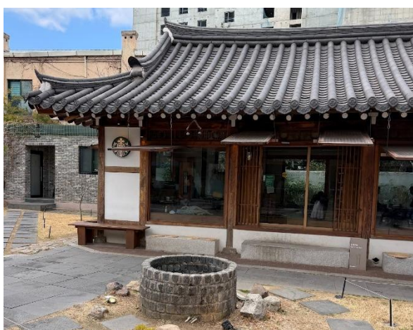
大邱市内で撮ったスターバックス

今後は本研修で得た知識と経験を国際交流の場で活かしていきたい。異文化理解においては相手の文化を尊重する姿勢が不可欠であり、そのためには継続的な学習と多角的な視点が求められる。今後もこうした姿勢を維持し、より良い国際交流の実現に努めていきたい。