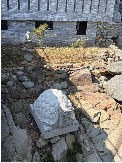
①海東竜宮寺内の亀の石像