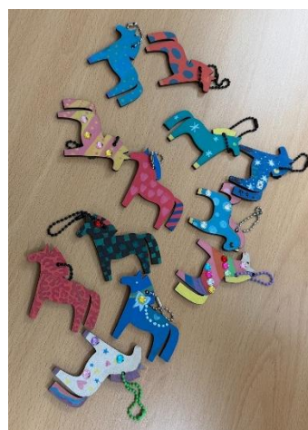
日本語の授業で作ったキーホルダー