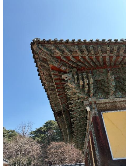
②仏国寺の龍のデザイン