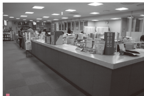
学生の様々な課題や相談に応じる「総合窓口」を設けた学生支援センター

常磐大学・常磐短期大学では、9月29日から10月10日にかけて、すべての学生を対象とする「学生生活満足度調査」を行った。この調査は、大学・短大に対する学生の満足度や意見を明らかにし、学生支援や授業内容の充実と改善に役立てるために実施している。前回は2006年度に実施しており、今回で2回目の調査となる。