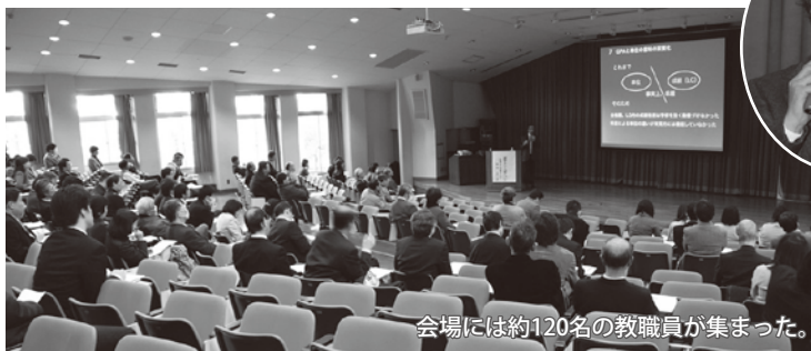
会場には約120名の教職員が集まった。