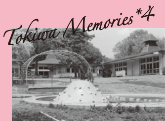
常磐学園短期大学附属幼稚園 (現・常磐大学幼稚園) 園舎外観 (1981年) *解説=8p